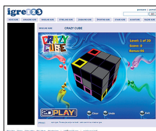
Pasica 160x600 ob igri

* Cena na tisoč prikazov v EUR. Cene ne vsebujejo DDV. Za oglaševanje s pasico 468x60 veljajo enake cene in oglasna mesta kot za pasico 728x90.