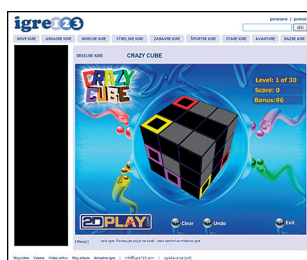
Pasica 160x600 ob igri

* Cena na tisoč prikazov v EUR. Cene ne vsebujejo DDV. Za oglaševanje s pasico 468x60 veljajo enake cene in oglasna mesta kot za pasico 728x90.